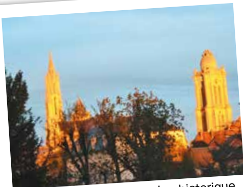
Préservons notre patrimoine historique.