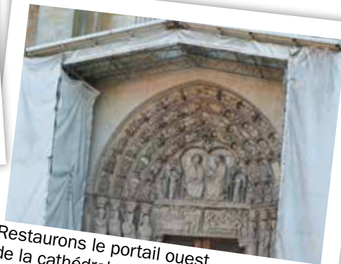
Restaurons le portail ouest de la cathédrale.