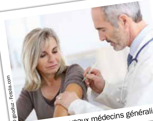
Attirons de nouveaux médecins généralistes.